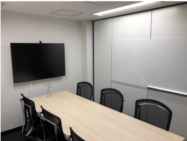
<新オフィス内の打ち合わせエリア（個室）>