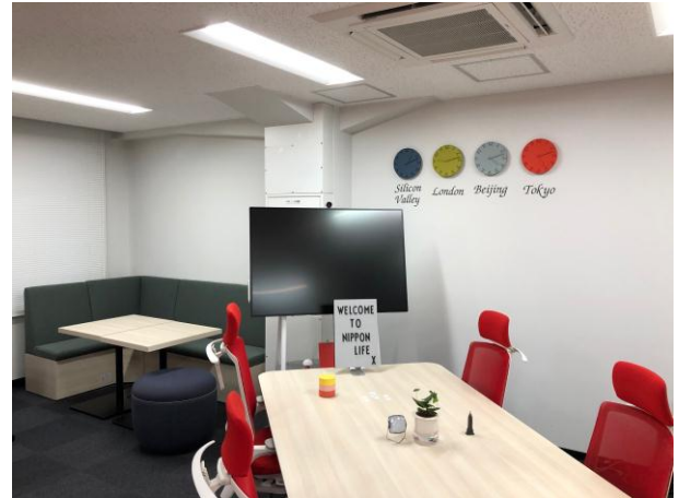
<新オフィス内の様子②>