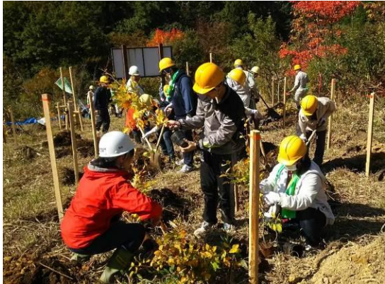
“ニッセイ鮭川の森” 植樹 (山形県)