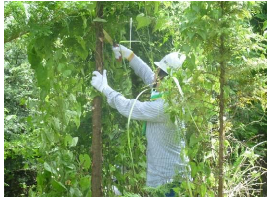
“ニッセイ富士の森” 枝払い (静岡県)