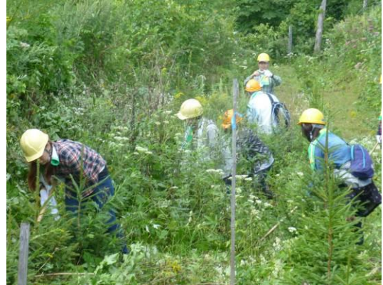
“ニッセイ支笏湖の森” 下草刈り (北海道)