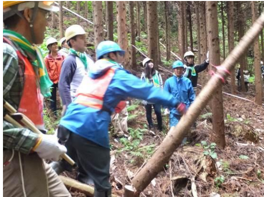
“ニッセイ夏泊の森” 間伐 (青森県)