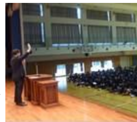
平成26年度 東京電機大学 中学校への出張授業の様子

「ニッセイ名作シリーズ」のオペラ・バレエは、一般（大人）向けと同じ内容の本格的な公演です。生徒たちが作品に対する理解を深め、より興味を持って鑑賞できるように、「事前学習用DVD」を学校に提供したり、日生劇場職員が「出張授業」を行い、舞台芸術の基本知識や見どころを解説したりしています。