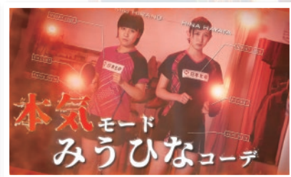
<CM>SNAPSHOT 平野美宇&早田ひなペアコーデ篇(web)