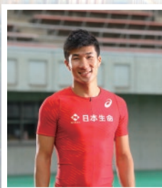
<日本生命所属> 桐生 祥秀選手(陸上競技)