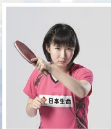
<日本生命所属> 早田 ひな選手(卓球)