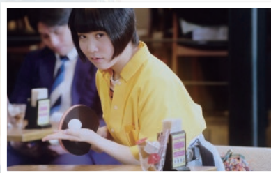
<CM>平野美宇がカフェで卓球するところなる篇(web)