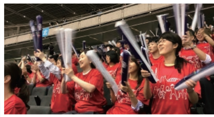
パラリンピックスポーツ観戦(2017年度 約6,300名参加)