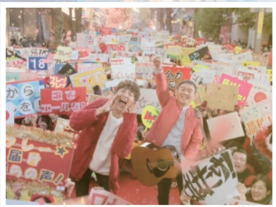
<CM>ゆず2018あなたにエールを篇(TV・web) 日本生命 平昌2018冬季オリンピック・パラリンピック日本代表選手団応援プロジェクト