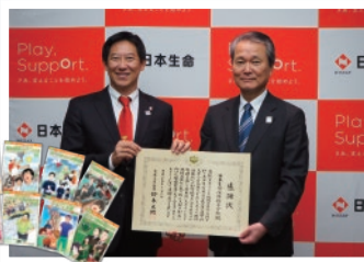
スポーツ庁「まんが スポーツで地域活性化」事例集に協賛(全国の中学校・高等学校等[約22,000校]へ寄贈)

日本生命は、東京2020オリンピック・パラリンピックを通じて、支え合う気持ちが、すべての人へ広がっていくみらいの実現を目指します。