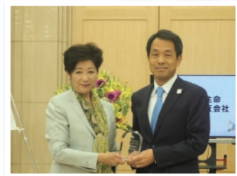
「平成29年度 東京都スポーツ推進モデル企業」として表彰