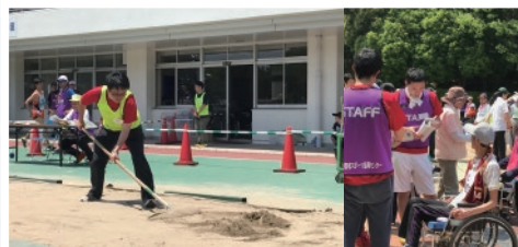
スポーツボランティア(2017年度 約2,700名参加)