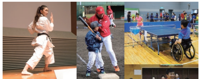
全国でのスポーツ教室の開催(2017年度 約3,800名招待)