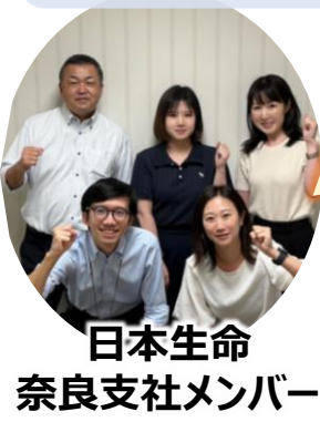
日本生命 奈良支社メンバー

2025年9月3日に「中小企業向け健康経営セミナーin奈良」を開催しました。(南都銀行さま、協会けんぽ奈良支部さま共催)当日は、参加企業さま向けの従業員の健康に関する体験ブースの出展も行い、約70名の方にお越しいただきました。