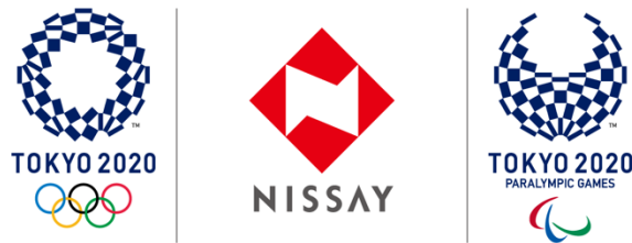
東京2020 ゴールドパートナー(生命保険)